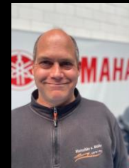
Kundenberater / Shop