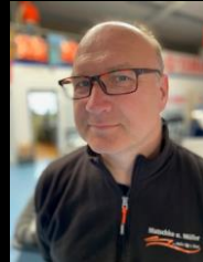
Leiter Service & Mobiler Service