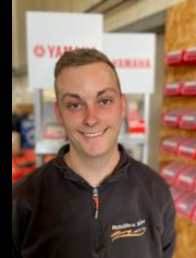
Service & Mobiler Service