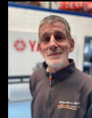
Kundenberater / Shop