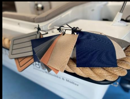
Valory V 480 Classic