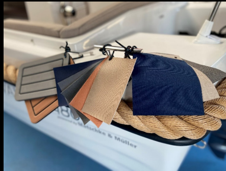
Valory V 480 Classic